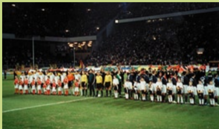
Gänsehaut: die Nationalhymnen werden gespielt.