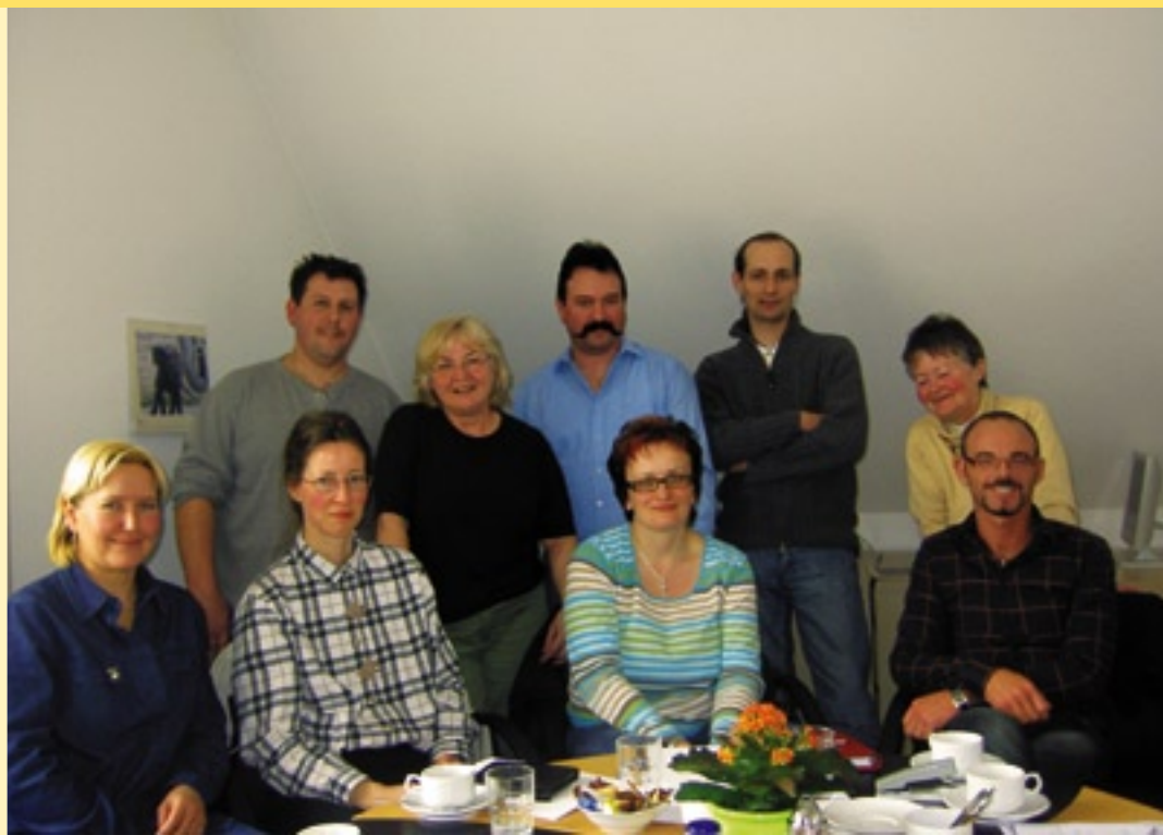
Die Mitarbeitervertretung der EAW (siehe Seite 10)