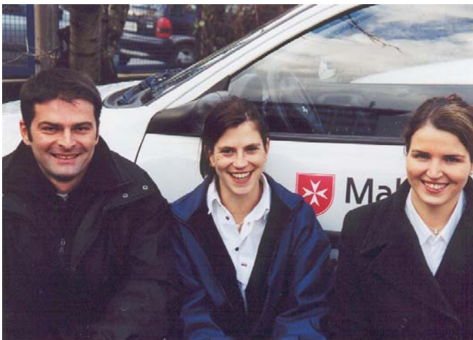
Die Teamleitung der Malteser Stuttgart

Rein: Ganz sicher werden die Rahmenbedingungen von Seiten der Kostenträger, also Krankenkassen und Pflegekassen sowie Sozialhilfeträger, immer schwieriger. Wir werden deshalb künftig nicht nur Instrumente für die Planung und Abrech-